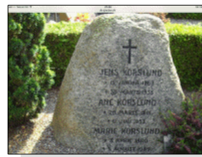
Gravsten Taars kirkegaard