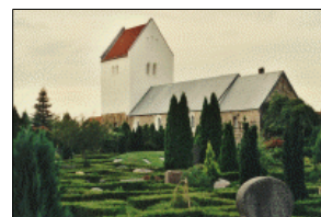
Vraa sogns kirkegaard